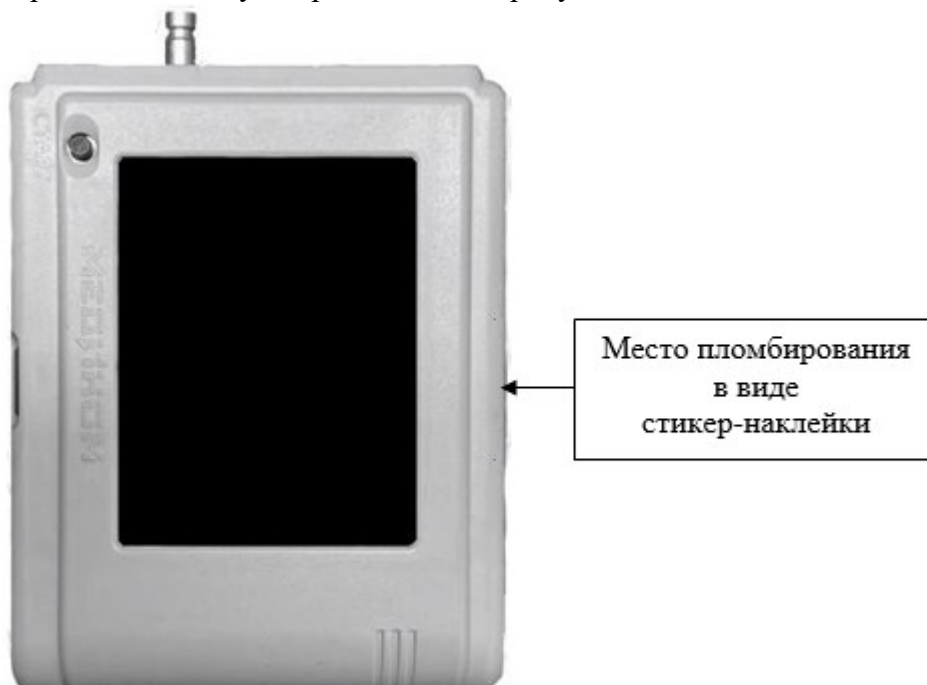
Рисунок 2 – Общий вид регистратора КР-07 из состава комплекса

Общий вид регистратора КР-07 из состава комплекса с указанием места пломбировки от несанкционированного доступа представлен на рисунке 2.